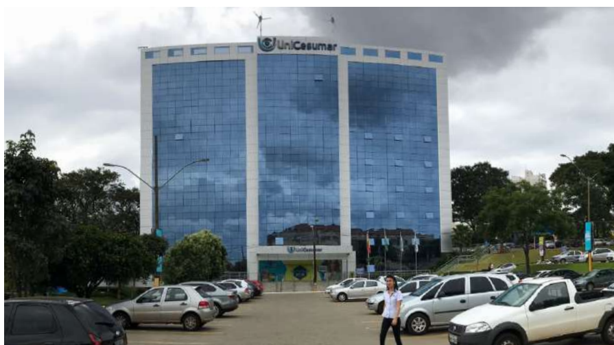
Sede da UNICESUMAR na cidade de Maringá, no Paraná

A estrutura de ponta e os bons índices apresentados até agora reforçam a crença da Unicesumar na sua missão, que é “Promover a educação de qualidade nas diferentes áreas do conhecimento, formando profissionais cidadãos que contribuam para o desenvolvimento de uma sociedade justa e solidária”. Para alcançar um número ainda mais expressivo de alunos, a universidade tem, entre outros programas, o Convênio Educacional Unicesumar, oferecido aos funcionários e dependentes de parceiros como empresas nacionais de pequeno, médio e grande porte, multinacionais,